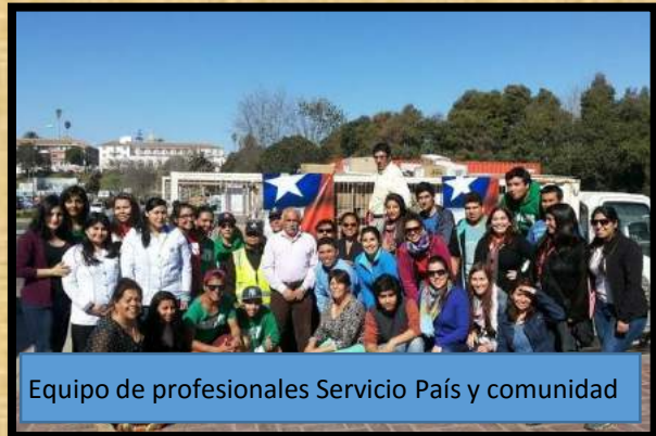
Equipo de profesionales Servicio País y comunidad