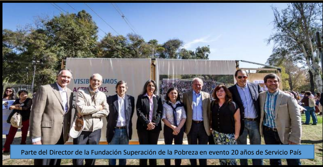
Parte del Director de la Fundación Superación de la Pobreza en evento 20 años de Servicio País