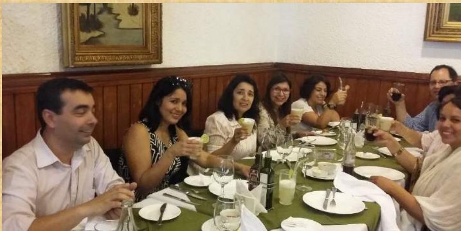
Celebración día de las secretarias