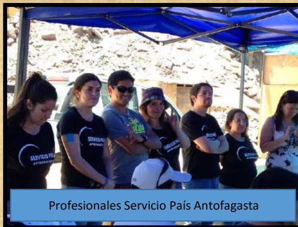
Profesionales Servicio País Antofagasta