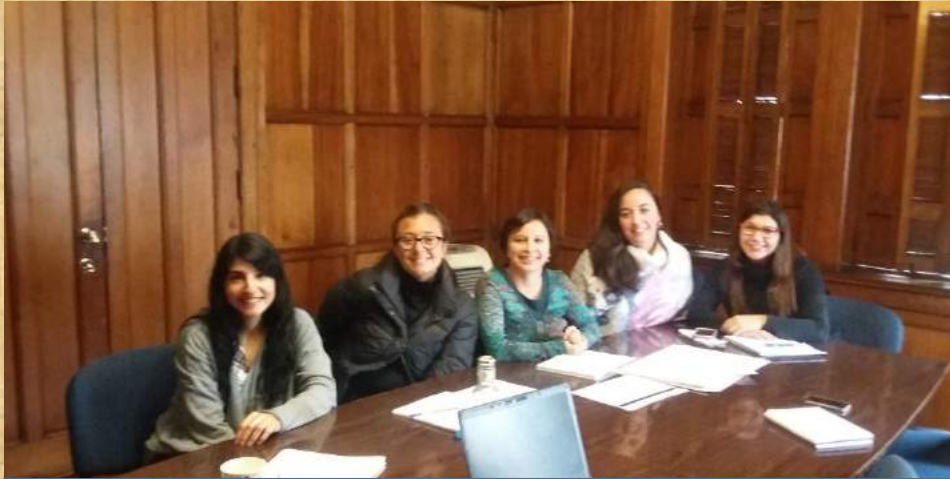
Comité de capacitación