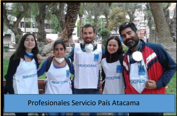
Profesionales Servicio País Atacama