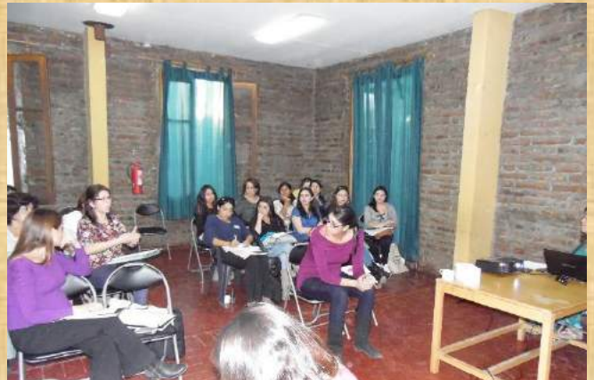
Capacitación secretarias FSP