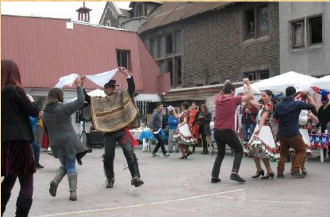
Actividad de Fiestas Patrias FSP